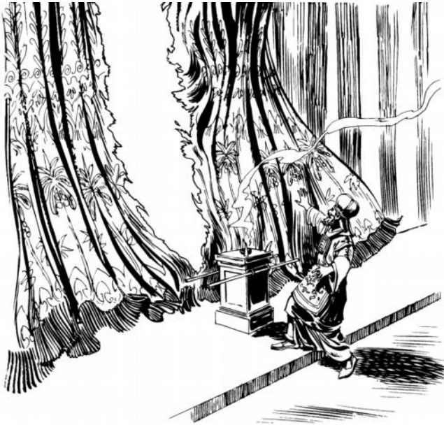
Maloli dawan amafal namadir lahir na'ut irua (Luk 23:45)

Ning vava'at a ma ufadoku na'a limam ralan a.” Ti ma nfallak munuk wean inyai, na nan a nakbosal vali. 47 Na'ut i dawan i nfareta Roma rir suldadu ra nsi'ik afa avyai, na nfadawang lahir Ubu ma nfallak ne, “Kena urun, tamata ini Ni vava'at nmalola!” 48 Tamata rivun ovi rma ma ramunin, rsi'ik vali afa avyai, ba rewal ira ma na'a rir banbanan obin, na ka'i rfefik buburira ra.*