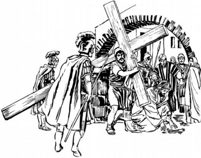
Simon i ntali Kirene nvara Yesus Ni aa walwalur a (Luk 23:26)

ini verin Ya'a i wol ning salasilan a, na ira veka rotu ma nlia verin mia, tamata ovi bir salasilan roak a. Ya'a weang aa i nva'at obin ma yafu wol bisma nasnuri nala. Na'uk mia weabira aa ovi rangaran roak a ma yafu veka nasnuri munuk lahir!"* 32 Ira rovun vali tamata ktufan irua ma veka rfaklo'i ira ma rmata ovu Yesus.