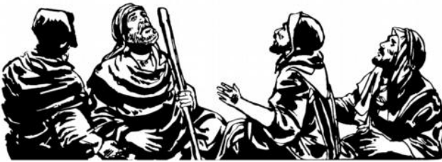
Domba duarira ra rsi'ik Ubu Ni sansinir tali lanit ratan ra, rivun ila'a ira rvotuk (Luke 2:13)

13 Brian munuk, na Duila'a Ni sansinir yai ovu Ni sansinir liak ra vali, rivun ila'a ira rvotuk. Rir tinemun rfadawang Ubu ma rfalak ne, 14 “Fara traning Ubu! Ia sa'i dawan Ia ovu nana'a wan i karatat lia munuk a. Na'a lanit ivavan ini, fara malinan watan verin tamata ovi Ubu naflahar roak ira.”