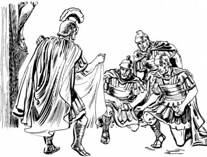
Roma rir suldadu rir rsoak nulu rir dawan i nfareta suldadu ratut isa (Luk 7:8)

verin ya'a. Wean i ufareta suldadu isa ma ufalak ne, 'Muti,' na ia nti lahir. Wean i ufalak verin isa vali ne, 'Mwa,' na ia nma lahir, te ufalak verin ning tamata sansinir a ne, 'Mkarya afa ini,' na ia notu lahir!"* 9 Yesus ntalkaka lahir na'ut i nrenar vaivatul avyai. Nata Ia ntamuri ma nfalak verin tamata rivun ovi rorang Ia ne, "Mryenar ma lolin afa i ufalak ini! Wol mane utuan lahir obin inorang i veran tamata yai ni inorang a, velik ne nana'a vali tamata Israel ra!" 10 Ti ma tamata ovi nsinir ira yai rewal ira rti Roma rir tamata dawan yai ni rahan a, na tamata sansinir yai lolin ewal roak ia.