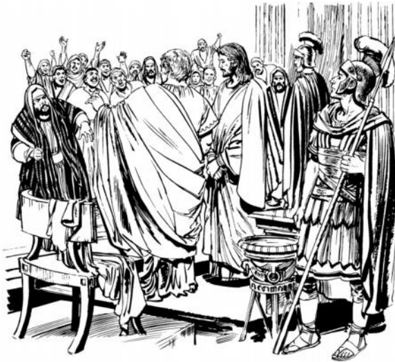
Yesus ndiri ovu Pilatus (Luk 23:2)

2 Ti ma raran Pilatus, na rmangadu Ia ma rfalak ne, “Ami amtuan roak tamata ini na'ut i nlabir nala mam tamata ra. Ia nfalak teri tamata ra ma deka rbahir babahir kulu verin Kaisar. Ia nfalak vali ne, Ia Raja i nfatalik ita tali inukun i musti tatuan tevek did salasilan ra.” 3 Ba Pilatus norat Ia ne, “Oa ini Yahudi rir raja verin Oa?” Yesus nfalak ne, “Oa ka'i fwalak roak yai.” 4 Pilatus nfalak verin Yahudi rir dawan mela falurut ra ovu tamata rivun avyai ne, “Ya'a wol utuan lahir sala akataka na'a tamata ini.” 5 Na'uk ira