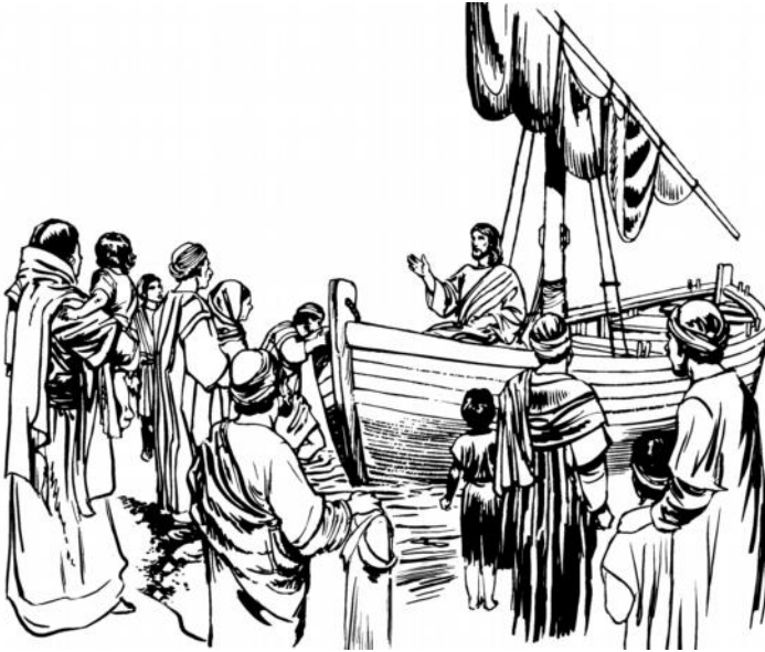
Yesus ndoku abau ralan ma nair tamata ra (Luk 5:9)