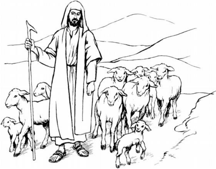
Domba duan ovu ni domba ra (Luk 15:4)