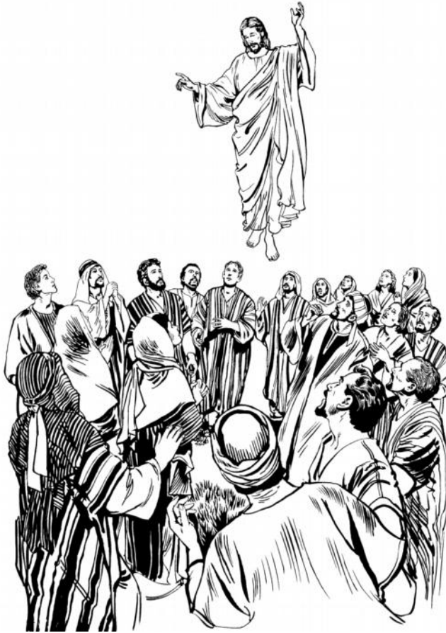
Yesus nrata lanit ratan (Luk 24:51)